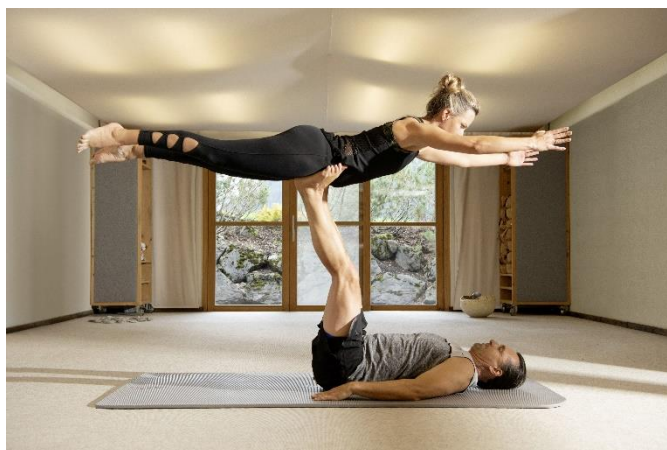
Corona 185/200 ideal auch für Partnertraining