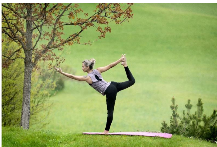
Anwendungsbeispiel Fitline 180, outdoor